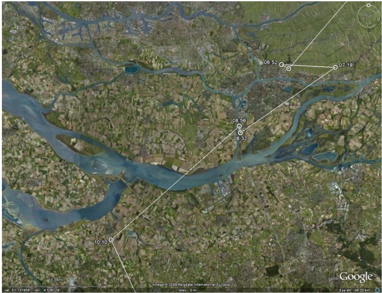
VLIEGROUTE GEZENDERDE BRUINE KIEKENDIEF.